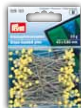
Épingles à tête de verre jaune, 20 g No. de code 029 153