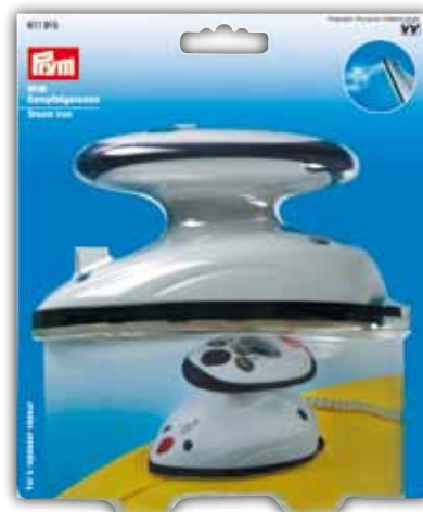
Fer à repasser vapeur Mini No. de code 611 915 No. de code 611 916 (pour UK)