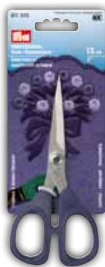
Ciseaux à broder/bricoler, 13 cm = 5" No. de code 611 510