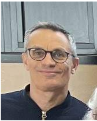
Lionel Pilates et gym