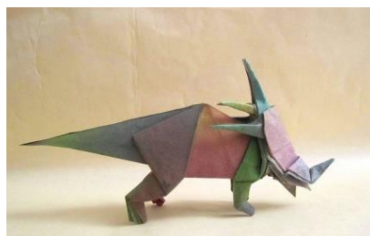
en papier japonais : Hamada Washi