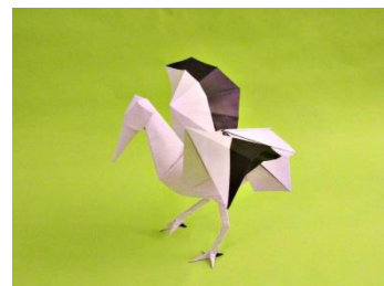
en papier noir-blanc : Canson