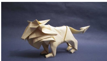
en papier artisanal : Moulin Richard-de-Bas