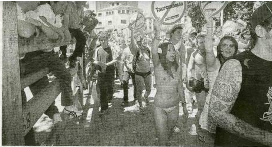
Algunos curiosos miran la marcha en la entrada de la Plaza de Toros.