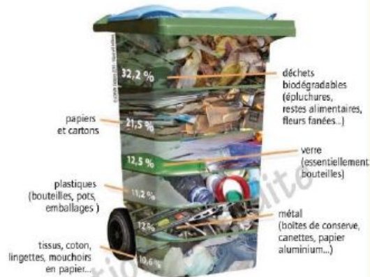
Part des différents types de déchets