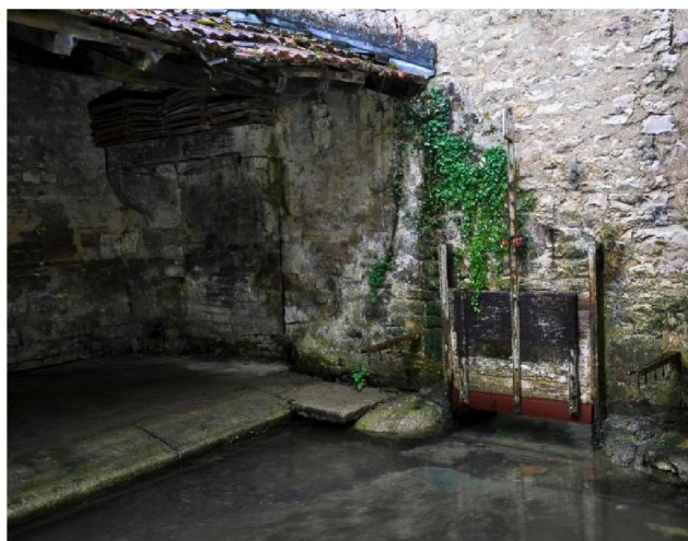
Dans le fond, à gauche, du lavoir « caché » de Bar-sur-Aube, on peut noter la présence d'une cheminée.