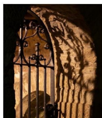
Ombres et lumière dans le lavoir circulaire de Colombé-le-Sec.