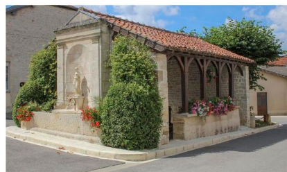
Colombé-le-Sec peut s'enorgueillir d'avoir deux lavoirs aussi différents que remarquables.