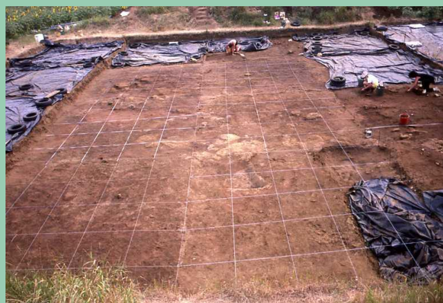
Vue générale de la fouille

Le responsable des fouilles archéologiques de Ligueil, Alain Villes assisté par Josiane Schoenstein, de Ligueil, présentera les résultats principaux des recherches menées aux « Sables de Mareuil » à Ligueil. De 1983 à 1993, cette fouille de « sauvetage programmé » a été menée par une équipe de bénévoles, avec l'aide de la Municipalité de Ligueil, sur crédits de l'Etat. Depuis lors, le terrain a été mis en jachère, pour éviter d'éventuels dégâts aux vestiges encore en place.