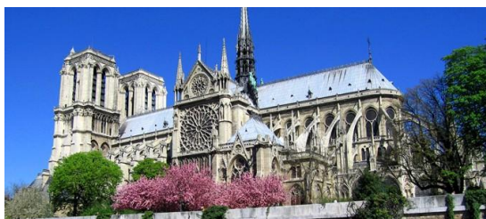
e) La cathédrale Notre-Dame visible depuis la Seine.