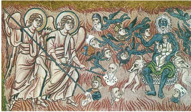
a) Torcello, (détail) Le Jugement dernier. Le sort des maudits repoussés dans le feu.

a) Au Moyen âge les chrétiens étaient extrêmement croyants et le désir d'aller au paradis tout comme la peur de l'enfer étaient une réalité. L'église avait su imposer sa vision de la vie sur terre comme une préparation à son passage dans l'au-delà. La majorité de la population ne sachant pas lire, de nombreuses églises ont été décorées de peintures et de sculptures qui rappelaient sans cesse que l'homme était jugé à sa mort.