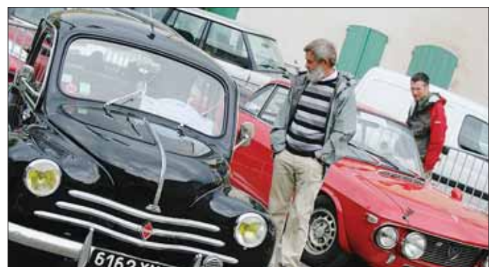
► Collectionneurs et passionnés, le centre ville devient l'étape indispensable des fous du volant.

Voitures de rêves, mythiques ou des souvenirs d'enfance , de la prestigieuse Jag à la populaire 4CV, les petits et surtout les grands ne gâcheront pas leur plaisir en allant admirer place Rose-Goudard ou alors près de l'église, les chromes rutilants et les élégantes calandres présentées par l'association des commerçants et des entrepreneurs L'Islois. Plus qu'une exposition "Hier, les transports", car le centre