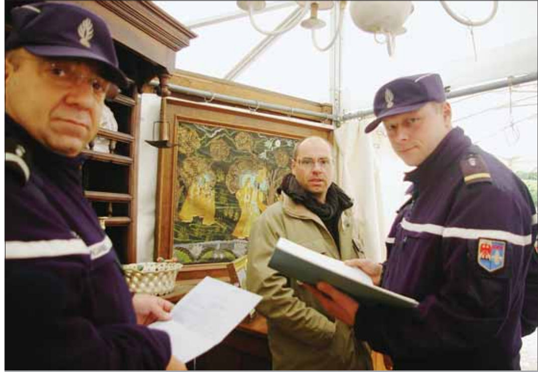
► Durant la Foire, les militaires de la cellule OVNAAB, ont vérifié l'ensemble des documents administratifs des exposants. Quelques procédures sans gravité ont été rédigées.

"Cela nous permet de vérifier si l'objet en question n'a pas été volé. C'est une protection essentielle pour les brocanteurs et ça évite le recel", ajoute-t-il. Cette cellule existe depuis environ 10 ans sur l'Isle-sur-la Sorgue. Elle travaille en lien étroit avec l'Office central de protection des biens culturels. "Il est parfois arrivé lors d'un contrôle de routine que nous tombions sur des objets volés dans le cadre d'un cambriolage", raconte le gendarme Éric Des-touches. En dehors des périodes de Foires Internationales, ces militaires spécialisés surveillent les marchandises de l'ensemble des boutiques situées dans la ville mais aussi interviennent sur tous les vide-greniers du secteur.