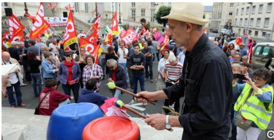
Dans une ambiance bonne enfant, sur la place de la mairie niortaise, les prises de parole se sont succédé.