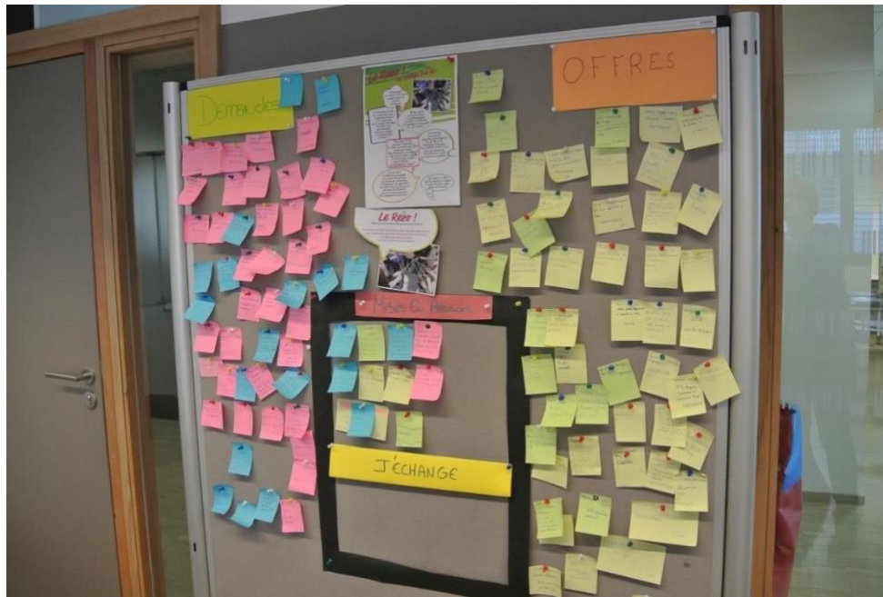
Tableau d'offres et demandes de savoirs au collège Bel-Air