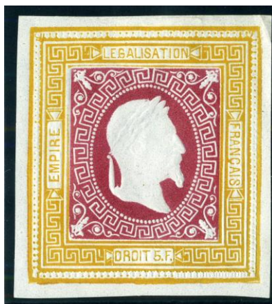
Jaune et carmin