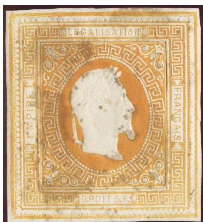
Orange et orange foncé