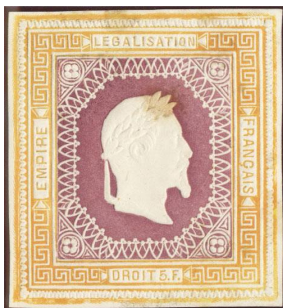
Orange et violet