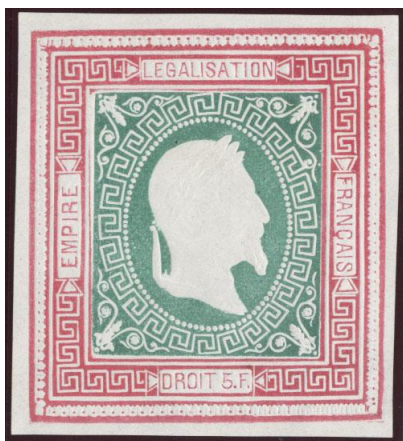
Rose et vert