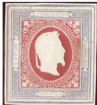
Lilas et rose