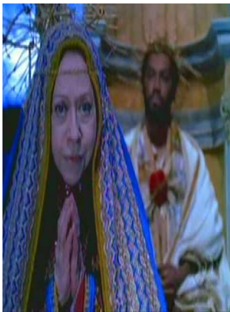
Notre-Dame e Jesus