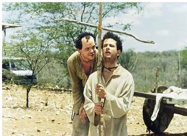
João Grilo e Chicó

Pour les français, c'est un film très intéressant, parce que il rapporte une autre culture, absolument différent de la française. C'est un film plein d'humour pour qui adore bonnes histoires et rire. Nous vous conseillons ce film!