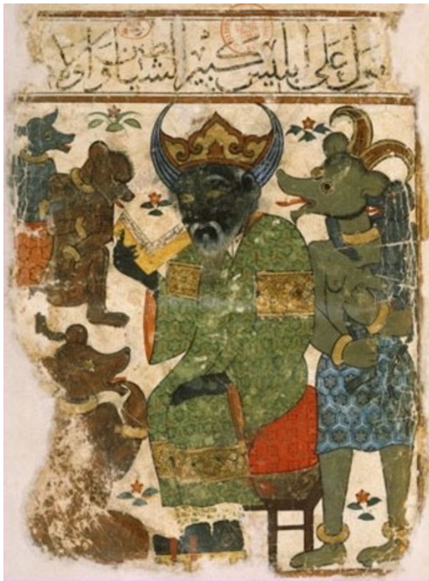
Représentation d'Iblis dans « Kitab al-Mawalid », 14ème siècle.