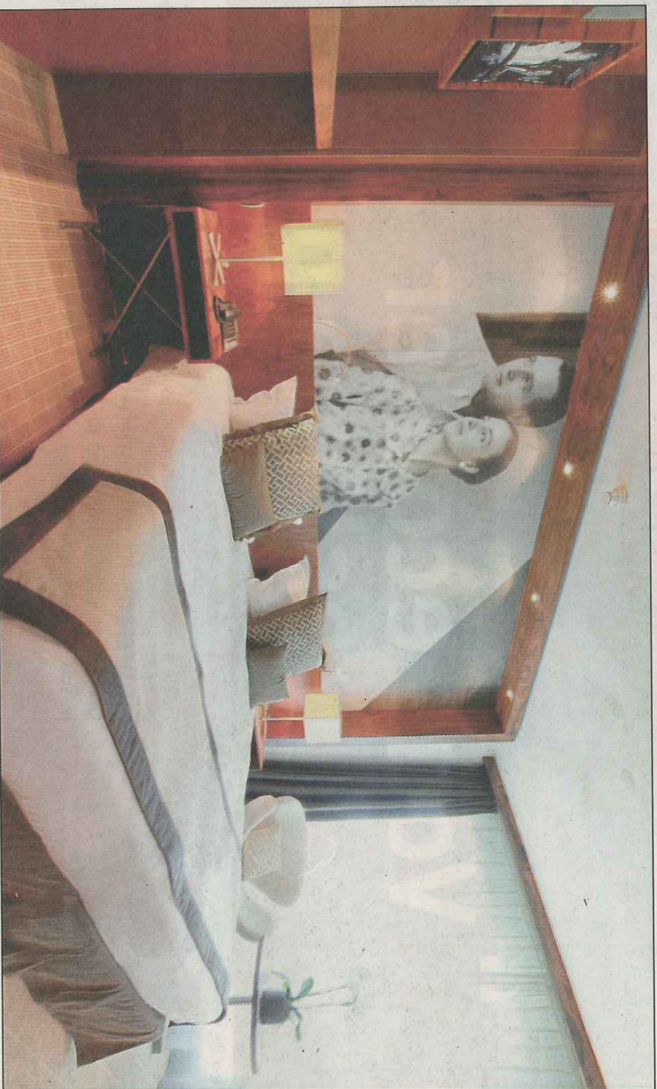
Oubliées les portes orange et les moquettes épaisses d'antan, désormais, les chambres du Palais Stéphanie font dans le contemporain. Avec des teintes crème et chocolat. Mélanges à des clichés en noir et blanc, hommage au septième art.

Tout ce petit monde a découvert, en avant-première, le nouveau vi-