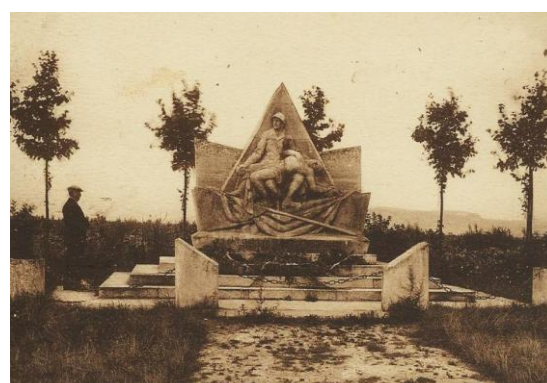
Pour la Tchecoslovaquie