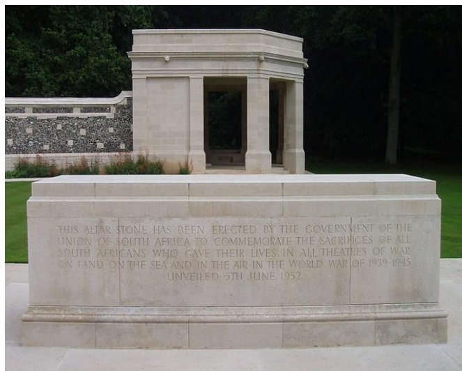
Mémorial aux Sud-Africains, Bois de Delville (80)

Création de 1993 car 10 000 hommes de la Force Impériale Australienne y ont été tués ou blessés lors des 2 batailles de Bullecourt (80).