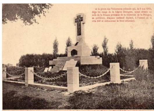
Pour la POLOGNE indépendante

La crête de Vimy est aujourd'hui boisée, chaque arbre a été planté par un Canadien et symbolise le sacrifice d'un soldat.