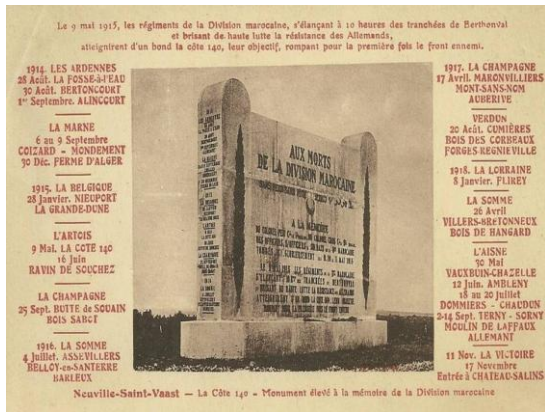
A la mémoire de la division Marocaine