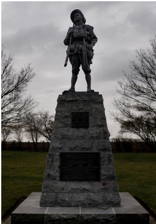
Parc mémoriel Australien de Bullecourt

Création de 1993 car 10 000 hommes de la Force Impériale Australienne y ont été tués ou blessés lors des 2 batailles de Bullecourt (80).