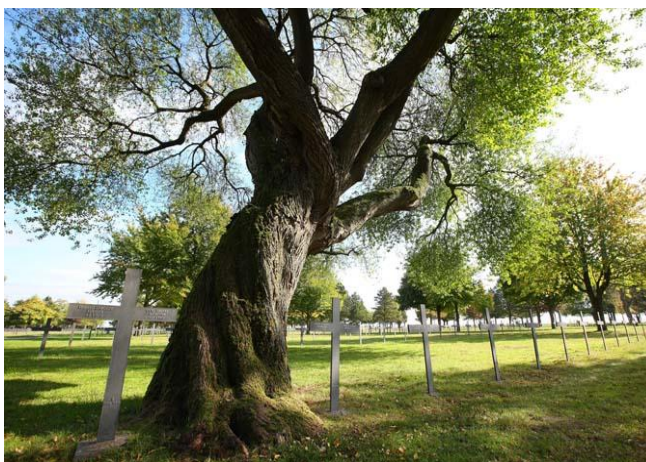
Nouvel agencement du cimetièrè allemand

En 1926, le Volksbund Deutsche Kriegsgräberfürsorge, Service d'entretien des sépultures militaires allemandes, subventionné par l'Etat fédéral allemand ( VDK ) est autorisé à intervenir sur ce territoire, sous le contrôle de l'administration française. Il aménage la nécropole de la Maison Blanche, jusque-là un simple champ non clos, en respectant les mouvements de terrain et en laissant une grande place aux arbres.