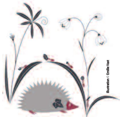
Illustration © Emilie Vast

TARIFS 16€ / 13€ / 5€ /// INFOS RÉSA 03 26 35 61 45