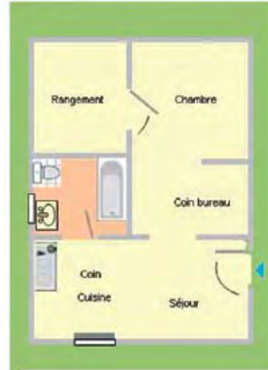
Le plan d'un studio