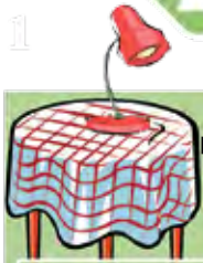
Une lampe pour éclairer