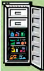
Un frigo pour garder les aliments.