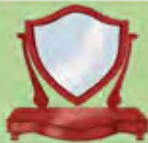
Un miroir pour se regarder