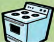
Un four pour cuisiner