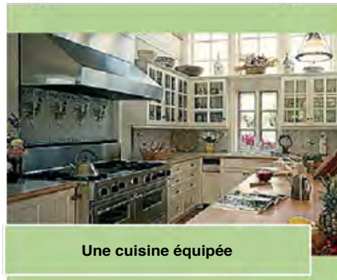
Une cuisine équipée