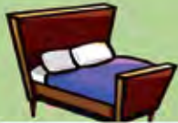
Un lit pour dormir