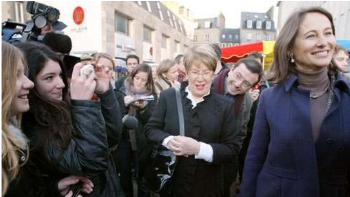
Ségolène Royal, samedi matin à Saint-Brieuc.

Samuel Laurent (lefigaro.fr) avec AFP, AP 12/01/2008 | Mise à jour : 20:56 | Commentaires 40