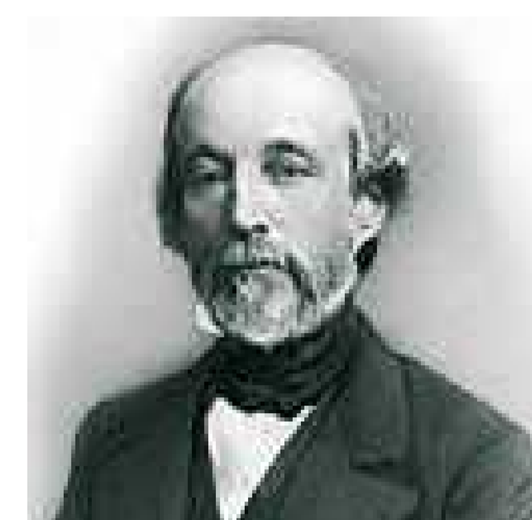
Alfred de Falloux

Loi Falloux : renforce le contrôle de l'église catholique sur l'école. Les communes de plus de 800 habitants doivent ouvrir une école de filles.