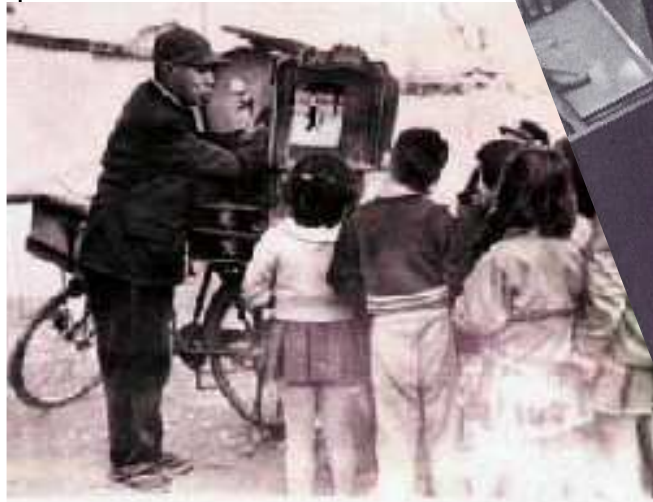
CONTEUR VERS 1960