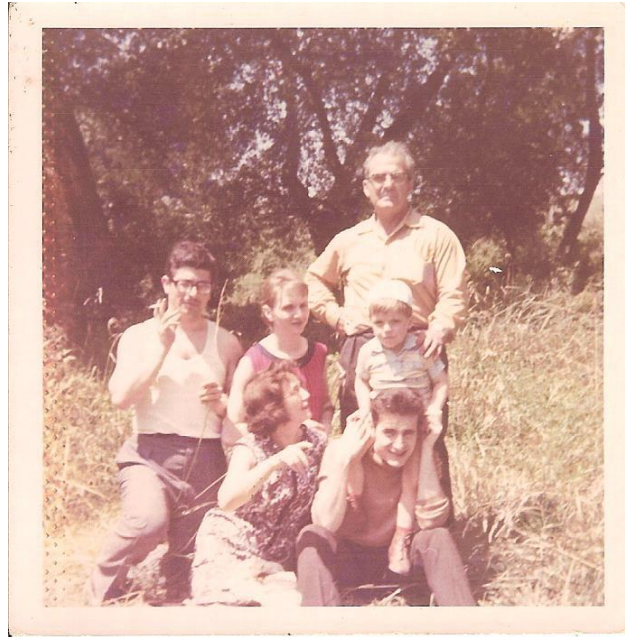
Avril 1969 (Pâques) Mon grand-père pose sa main sur mon épaule

Le 5 août 1969 (à 56 ans), il est à la retraite SNCF