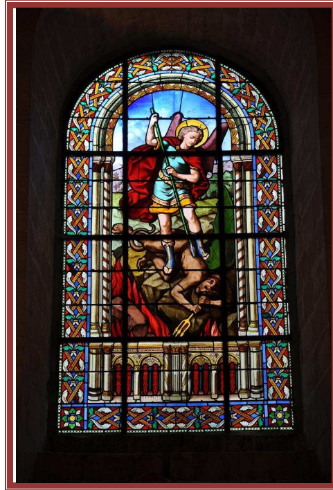
Vitrail église Juziers représentant Saint Michel terrassant le mal