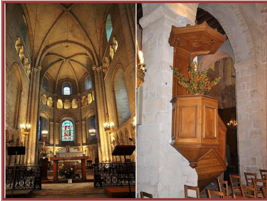
Chœur de l'église de Juziers et chaire de prédication

Le transept, voûté d'ogive au 12 e , date de la même campagne de construction que le chœur. Le clocher primitif s'étant effondré, ce dernier a subi de profondes transformations. Il conserve cependant, au nord son aspect originel. Le croisillon sud a été modifié pour recevoir le nouveau clocher au 18 e !