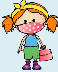
Je porte un masque