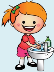
Je me lave les mains