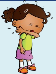
Je tousse dans mon coude