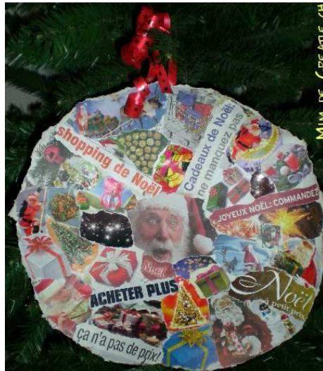
« Shopping de Noël », De Mim

Emballage cadeau fait à partir de journaux (2007)