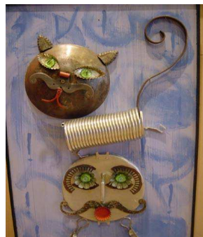
« Pause poub' », par Mim

Personnages faits à partir de fils de fer, capsules métalliques, serrure, porte-clés, mousquetons, trappe à essence... (2001)