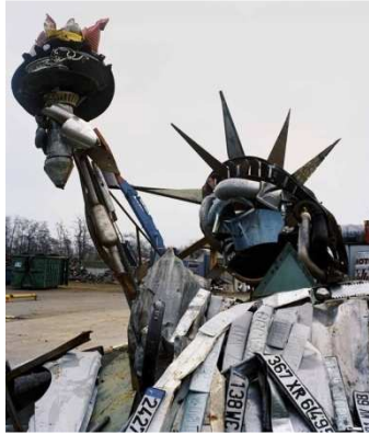
« Rhorr environnement ». De Bernard Pras

Statue de la Liberté à partir de plaques d'immatriculation, canettes, pièces de voitures (pot d'échappement), emballages d'aliments (2003)