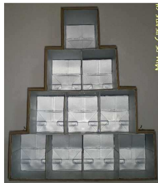
« Design argenté », De Mim, meuble CD en briques de lait (2008)