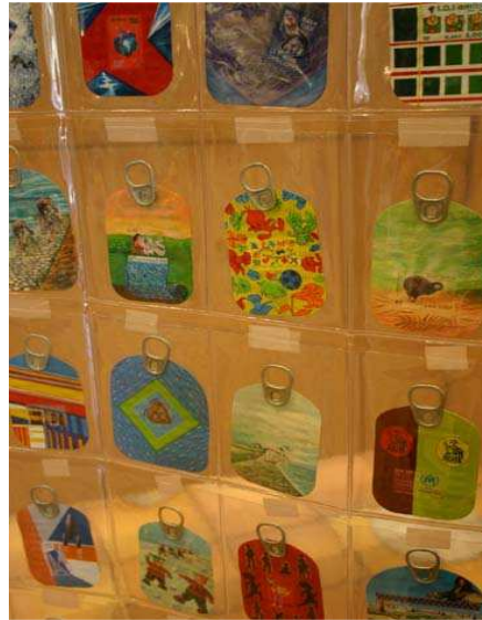
« Thèmes divers », Vincenzo Tolosa Peintures sur couvercles de boîtes de conserve (2003)