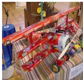
« Modél'art », Kamel Hakfur Avions et voitures faits de capsules, canettes, emballages en carton et en plastique, futs de bière... (2003)