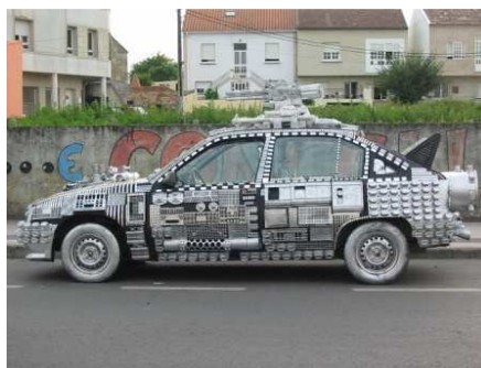
« Voiture design », Bredif Vincent Voiture entièrement réalisée en pots de yaourt (2005)