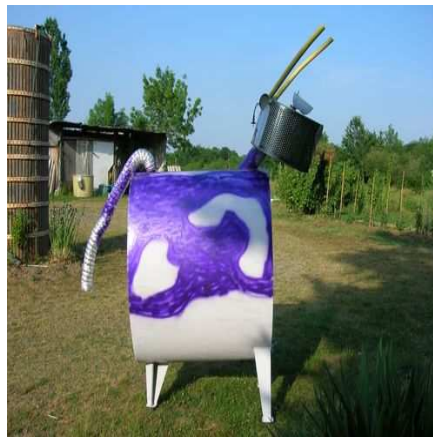
« Vache Milka », De Mim

Réalisée à partir d'une cuve à mazout, tuyaux en plastique, tambour d'une machine à laver, buse d'évacuation en aluminium (1999)