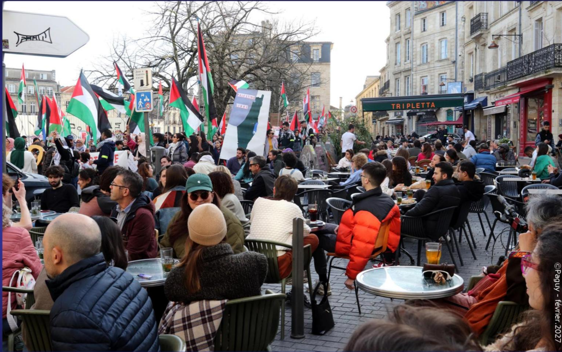
Pour la Paix à Gaza, contre l'agression Israélienne, le respect des Droits du Peuple Palestinien Quartier St. Michel à Bordeaux - samedi 17 février 2023