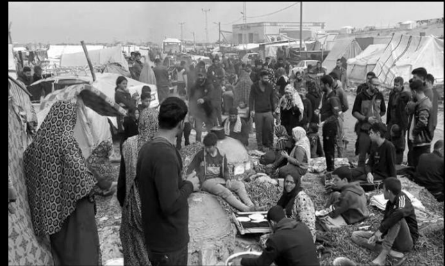
Guerre entre Israël et le Hamas à Rafah les déplacés Gazaouis