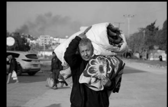
C'est en soutien à ceux de droite que je manifeste avec ceux de gauche ! Paguy