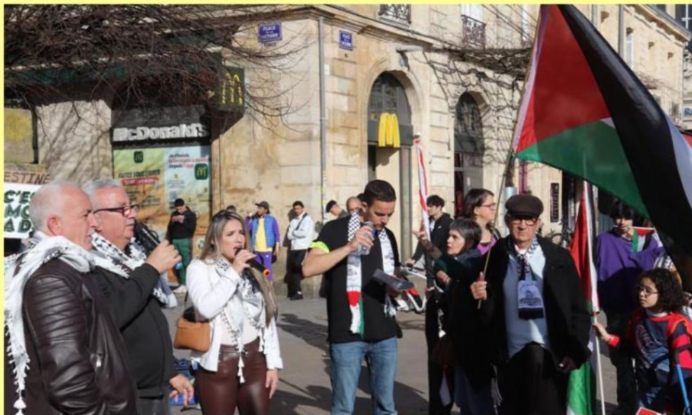
En tournée en France, deux Palestiniens de Naplouse prennent la parole lors du rassemblement qui s'est tenu place de la Victoire ce samedi 17 février