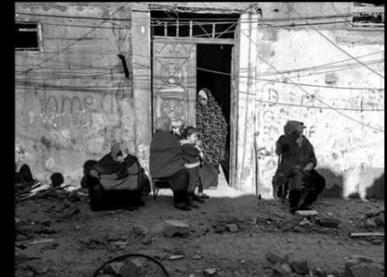
Des femmes palestiniennes sont assises dans les décombres dans un camp de réfugiés à Rafah tout au sud de la Bande de Gaza