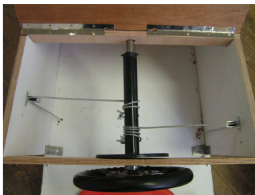
1er Schéma: Avec poulie et bobine Vue de dessus, Volant parallèle au sol

- la direction à tiges : version simplifiée. Le volant est fixé à un axe en forme de T sur lequel les câbles viennent se fixer, puis reliés à l'axe des roues. Le volant est donc manœuvrable perpendiculairement à la route! →schéma 2