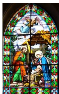
Église St-Pierre de Montières-Amiens

Pour les chrétiens, la fête de Noël (du latin natalis, "naissance", "nativité") célèbre la naissance de Jésus, Fils de Dieu, le Sauveur attendu, annoncé par les prophètes. Jésus veut dire en hébreu " Dieu sauve ". Ce nom même révèle son identité et sa mission, sauver les hommes et les conduire vers le Père. La naissance de Jésus est le coeur de ce qu'on appelle le " mystère de l'Incarnation ": " Au temps établi par Dieu, le Fils unique du Père, la Parole éternelle, s'est incarné : sans perdre la nature divine, Il a assumé la nature humaine ".