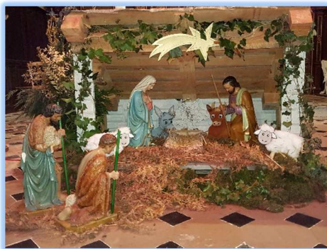
Crèche de Grossoeuvre 2021

C'est dans ce cadre que nous avons à accueillir l'invitation du Pape, relayée par notre Évêque pour nous associer dans les groupes qui ont été créés au sein de la paroisse pour échanger sur ce que nous vivons de ces trois thèmes ou alors nous avons la liberté de choisir une thématique parmi les dix qui nous sont proposées dans la feuille de route (cf. communiqué/ blog de la paroisse) et apporter une contribution à ce processus synodal pour un engagement missionnaire.