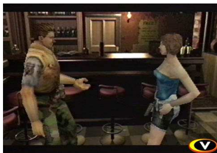
Brad Vickers et Jill