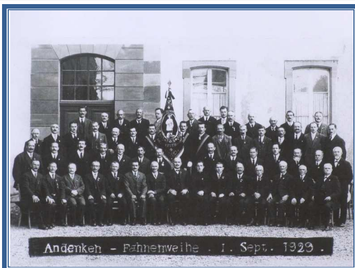
Société des Hommes catholiques 1.9.1929