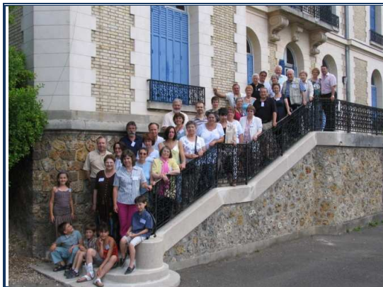
Mini cousinade à CONFLANS STE HONORINE 5.7.2009

(loi 1901 déclarée à la S/Préfecture de Mantes la Jolie sous le n° 0781006877)