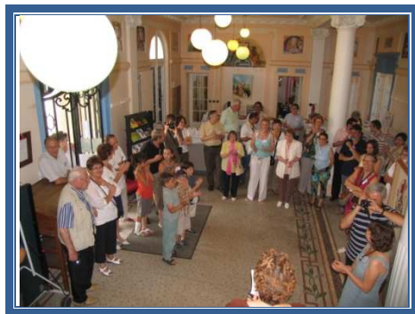
Avant le vin d'honneur... Discours

18 heures séparation de tous avec la promesse d'une nouvelle et prochaine GRANDE COUSINADE sans doute en 2011 qu'on se le dise !