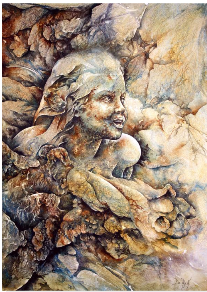
« Trésor de Pierre » ( Stone Treasure ), aquarelle sur papier Arches grain fin, 52 x 36 cm, 2010.

L'artiste a été choisie pour participer à la 199è exposition du Royal Institute of Painters in Water Colours (RI) . Ci-dessous, l'aquarelle sélectionnée :