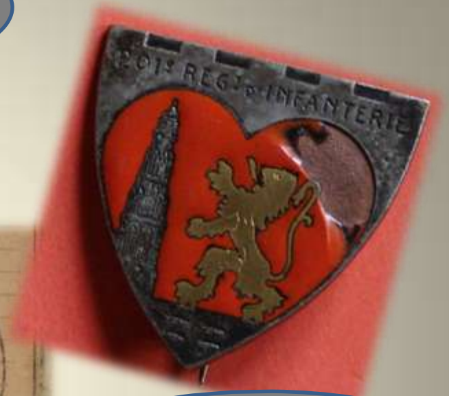
L'insigne du 201 e RI, régiment constitué à Arras en septembre 1939