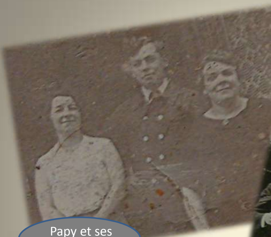
Papy et ses tantes