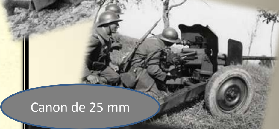
Canon de 25 mm