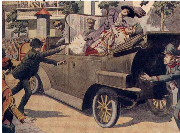
L'attentat de Sarajevo

Le 28 juin 1914, l'archiduc François Ferdinand est assassiné à Sarajevo par un étudiant nationaliste serbe. L'Autriche-Hongrie déclare la guerre à la Serbie, alliée de l'Empire Russe, déclenchant ainsi l'engrenage des alliances et l'entrée en guerre des pays alliés. (voir Doc 1 p. 22)