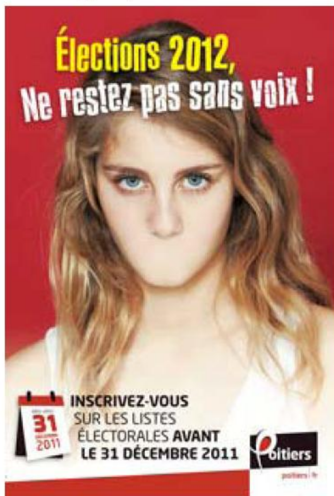
Affiche, Site internet de la ville de Poitiers, novembre 2011