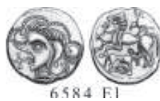
II/VI. Monnaie d'or des Osismes (région du Finistère)