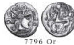
IV/VI. Monnaie d'or des Parisii (région de Paris)