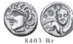
V/VI. Bronze des Ambiens (région d'Amiens)