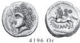
I/VI. Monnaie d'or des Bituriges (région de Bourges)