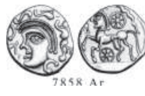
VI/VI. Monnaie d'argent des Suessions (région de Soissons)