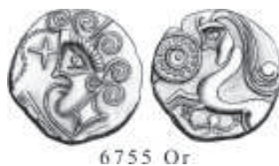
III/VI. Monnaie d'or - exemplaire unique (Armorique)