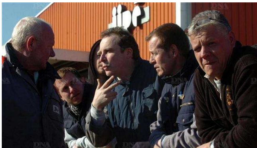
Les salariés de l'entreprise Atemco-Jipé ont débrayé 59 minutes hier sur le site de Châtenois.

En redressement judiciaire depuis le 1 er février, la société Atemco-Jipé de Châtenois annonce la suppression de 33 postes. Les salariés ont débrayé 59 minutes hier en protestation du plan de redressement.