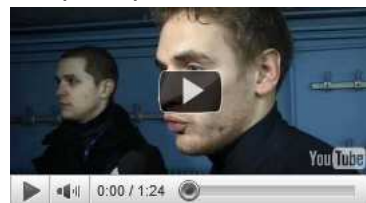
Réactions Racing Gueugnon

Retour sur l'ambiance de dimanche, à la Schlucht et au Lac Blanc