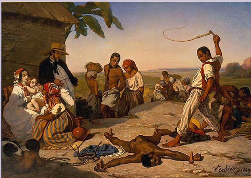
La punition des quatre-piquets infligée à un esclave sous le regard bienveillant du maître et de sa famille. Tableau de Marcel Verdier, 1849.

Article 42 : Les maîtres pourront, seulement lorsqu'ils croiront que leurs esclaves l'auront mérité, les faire enchaîner et les faire battre de verges ou de cordes. Mais nous leur défendons de leur donner la torture, de les mutiler sous peine de leur confisquer les esclaves et d'agir contre eux.