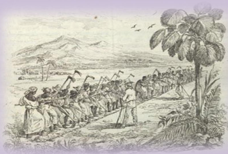
Esclaves au travail dans un champ sous la surveillance du contremaître.

Réponse : Les esclaves de pioche défrichaient la terre et la retournaient pour les plantations. Les contremaitres avaient pour responsabilité la surveillance du travail et devaient veiller au bon fonctionnement de la plantation.