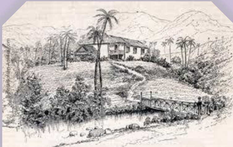
Une habitation (peut-être la Pagerie en Martinique), Source inconnue.