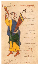
Ut queant laxis