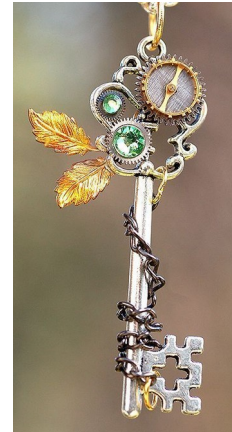
Clé de Lucie