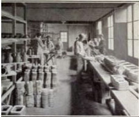
Un atelier de coulage