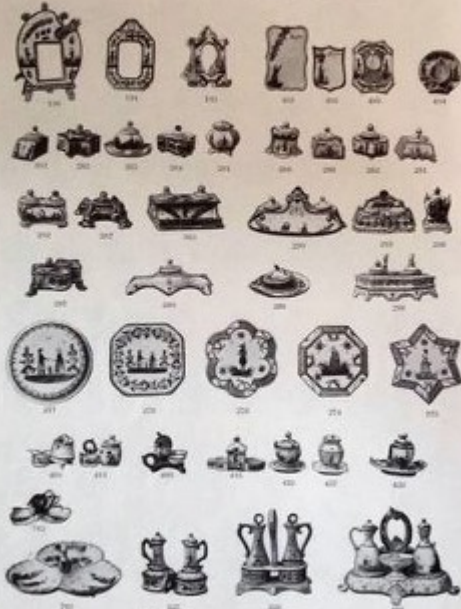
HENRIOT - QUIMPER