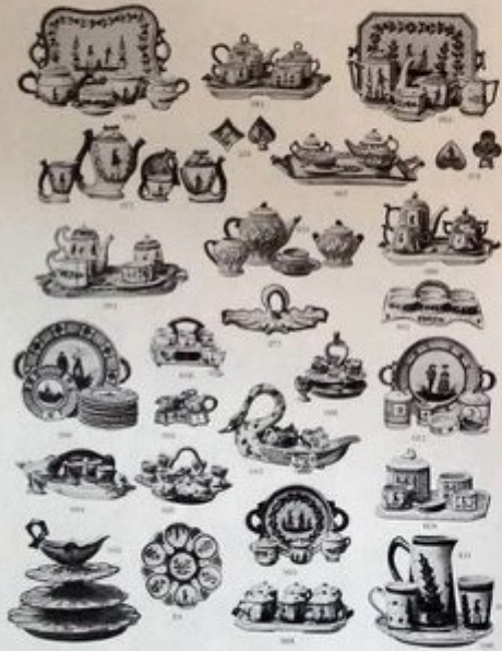
HENRIOT - QUIMPER