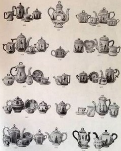
HENRIOT - QUIMPER