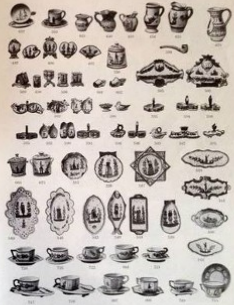
HENRIOT - QUIMPER