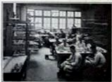
Un atelier de peinture

Sa production consistait à l'origine, en grès servant aux usages domestiques de la région, bouteilles, cruches, saloirs; en poteries vernissées aux naïfs dessins hispano-mauresques, rouges, noirs, blancs, décorant les écuelles et les plats utilisés dans les noces et les fermes bretonnes; en faïences rustiques aux grosses fleurs, coqs, ornements linéaires, ou en copies des anciennes fabrications de Moustiers, Nevers.