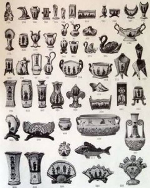
HENRIOT - QUIMPER