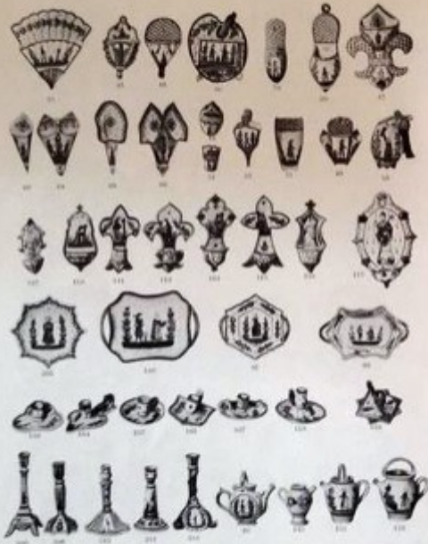
HENRIOT - QUIMPER