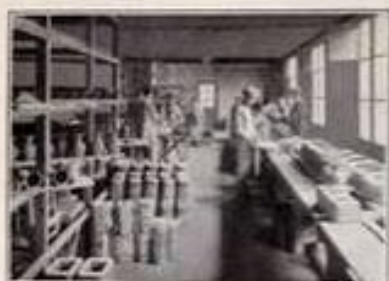
Un atelier de montage