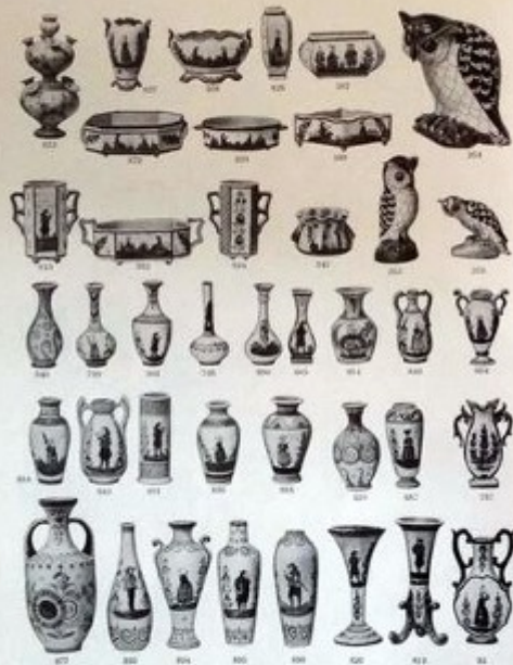
HENRIOT - QUIMPER