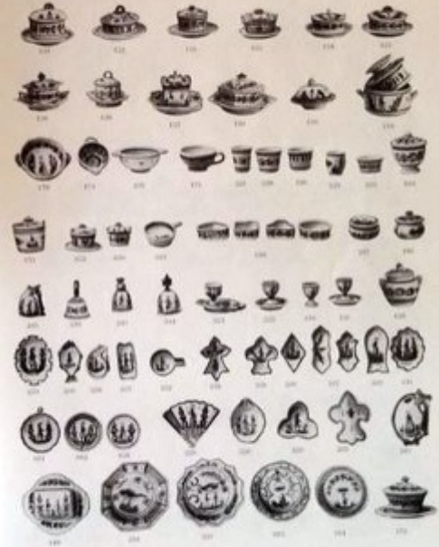
HENRIOT - QUIMPER