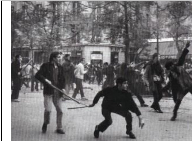
Doc 6 : Les manifestations de Mai 1968