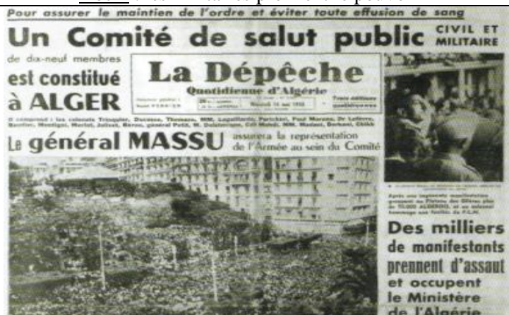
La Dépêche quotidienne d'Algérie, 14 mai 1958