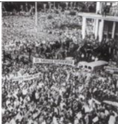
Sur les banderoles, on peut lire « Algérie française » et « de Gaulle au pouvoir »