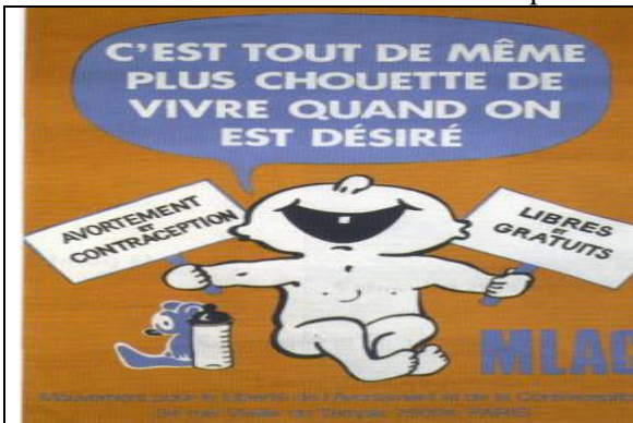
Doc 7 : Affiche en faveur de la contraception et de l'IVG (1975)