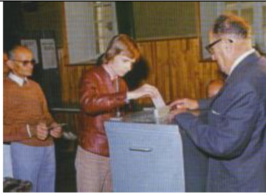
Doc 5 : Le vote à 18 ans (1974)