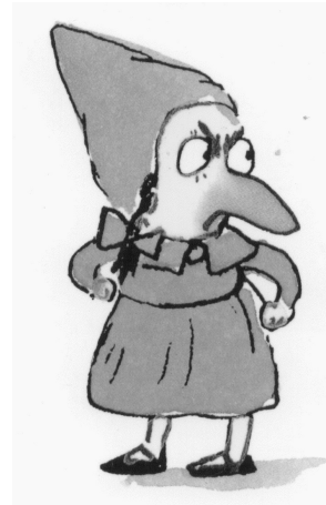
LE PETIT CHAPERON BLEU