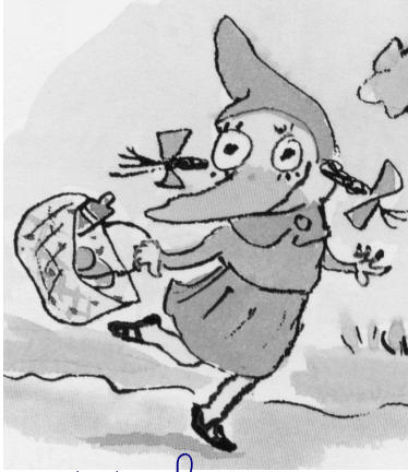
le petit chaperon rouge