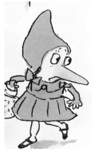
le petit chaperon violet