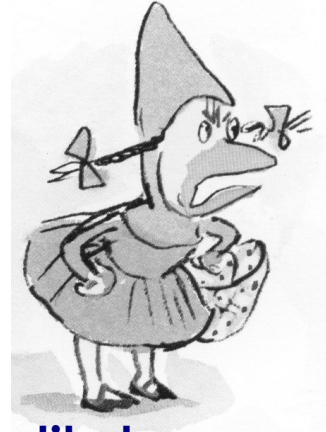
le petit chaperon vert