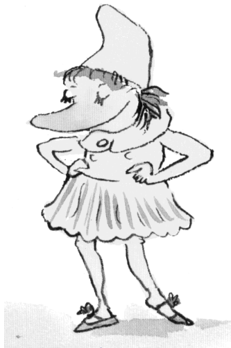
le petit chaperon jaune