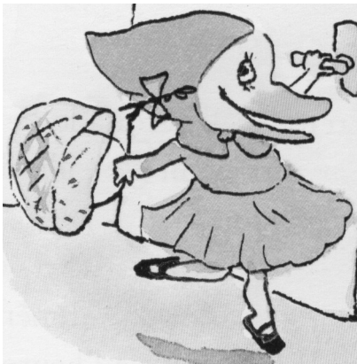
le petit chaperon rose