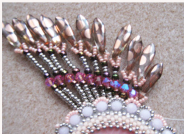
Schéma «lou soulèn» - Collier ou bague