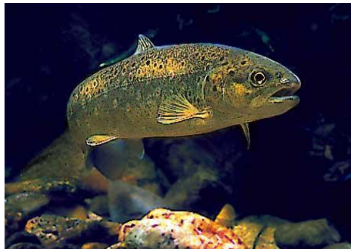
poisson - poisson