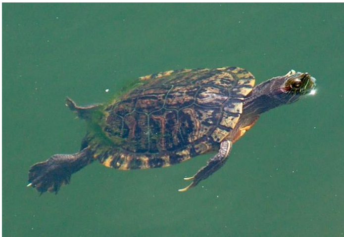
tortue - tortue