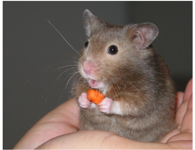
hamster - hamster