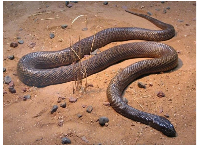
serpent - serpent