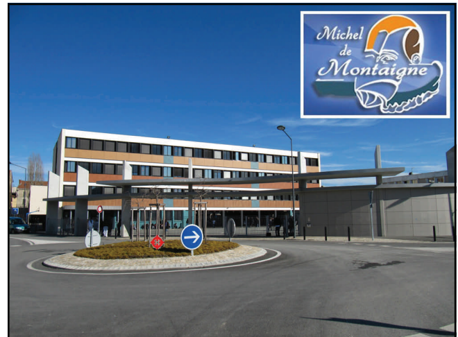
From the earth / Vu du sol

Our “collège Michel de Montaigne” is a school with :