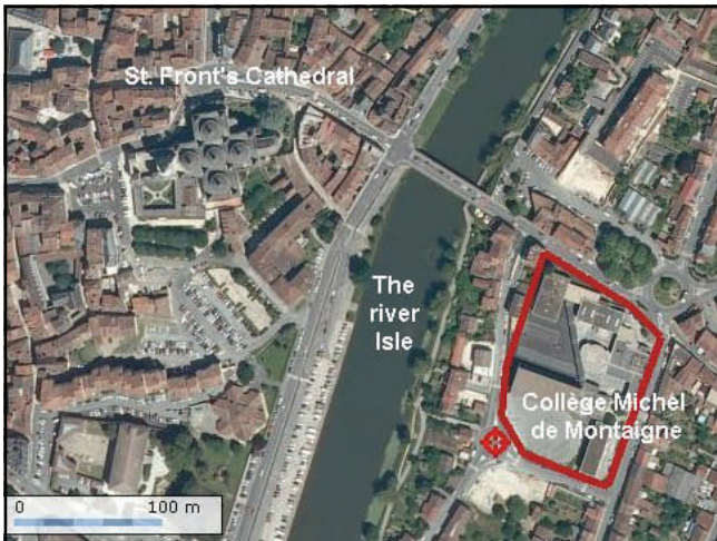
From air to earth / Vu du ciel