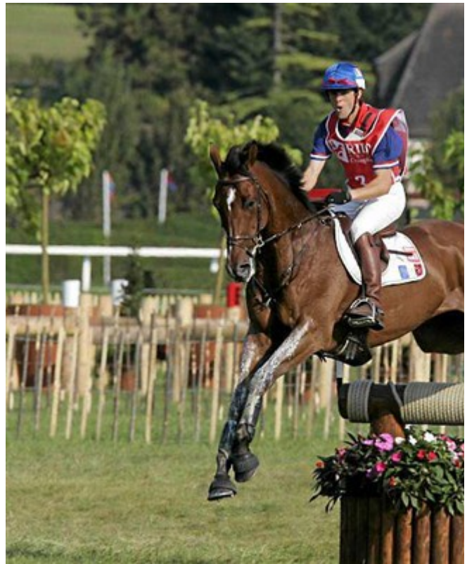
Le conseil général ne remet pas en cause sa participation à l'organisati... veut des assurances pour un budget maîtrisé.

Le Département confirme les 3 millions d'euros pour l'organisation des groupement d'intérêt public, il faudra attendre.