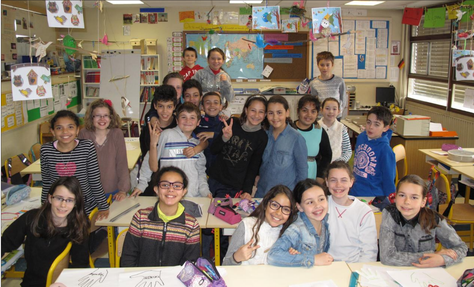
À Chambéry, les élèves de l'école Haut-Maché ont réalisé une série de travaux sur le thème de la fraternité, qui a complètement changé leur attitude selon leur enseignante.

Dans l'école du Haut-Maché, à Chambéry, on ne badine pas avec la fraternité