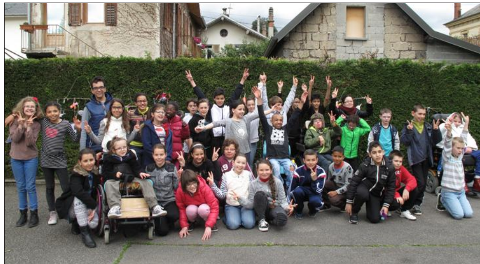
Les enfants de Haut-Maché et de l'Accueil savoyard se sont retrouvés le temps d'une matinée pour partager un moment ensemble.

Le projet "Rêves de gosse" a réuni les élèves de l'école Haut-Maché et de l'Accueil savoyard, depuis le 27 janvier dernier. C'est à cette date que les élèves de CM1/CM2 de l'école ont fait le déplacement jusqu'à la structure spécialisée pour rencontrer ceux qui depuis, sont devenus leurs amis.