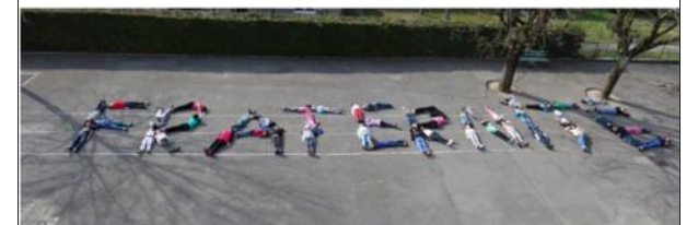
Les élèves ont tracé le mot fraternité avec leur corps sur le sol de la cour de récréation de leur école.

En février dernier, les enfants de CM1/CM2 ont formé avec leur corps les lettres du mot "fraternité", sur le sol de la cour de récréation de leur école Haut-Maché. Les mains liées, allongés par terre, ils ont écrit leur propre version de la