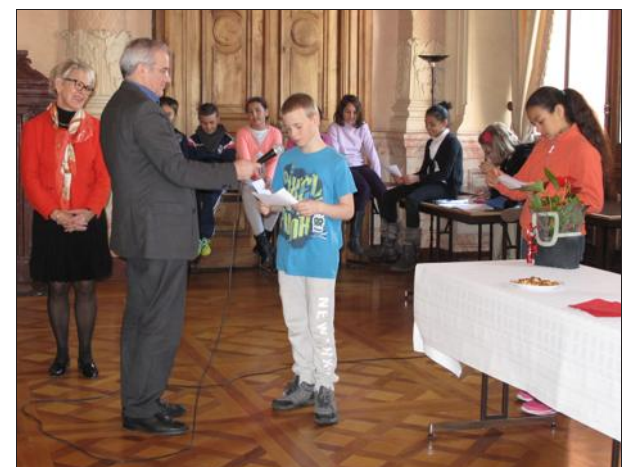
Les élèves ont défilé l'un après l'autre devant le maire, qui leur a tendu le micro pour entendre leurs questions.