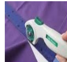
Cutter rotatif (avec tapis de coupe)