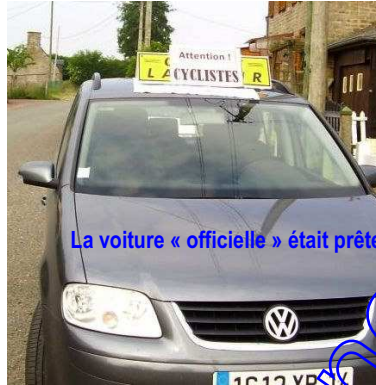
La voiture « officielle » était prête

Il faisait pourtant très beau en ce dimanche, 3 juin... Tout incitait à « mettre le nez dehors » Le Maire attendait devant la mairie... Les deux adjoints étaient là avec leurs vélos pour accompagner le groupe, ainsi qu'un conseiller municipal ; les épouses des deux adjoints étaient prêtes, au volant des 2 véhicules d'accompagnement