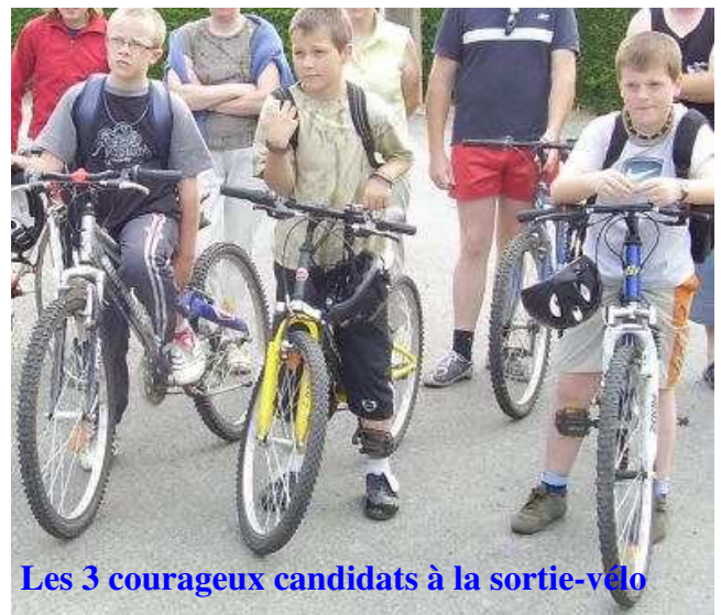
Les 3 courageux candidats à la sortie-vélo