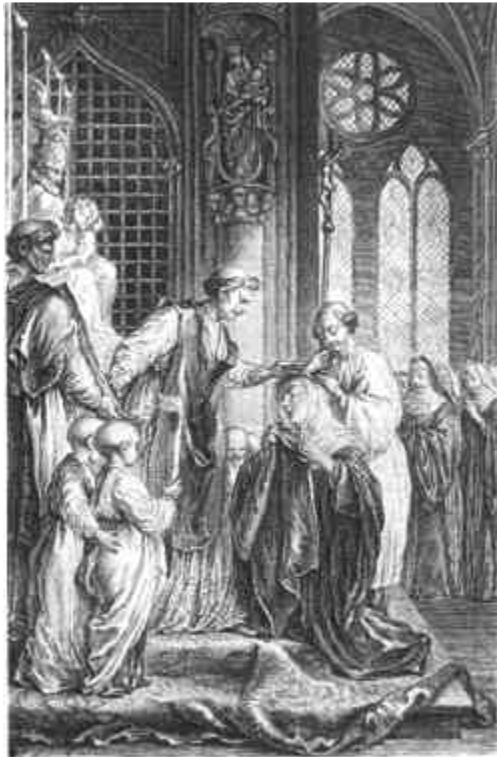
Plaque de l'abbaye de Coulombs, gravure d'après une peinture de l'école de Meulan (Bibl. nat., Coll. D. 8033)

En 1033 mention d'Héloïse (date de son décès) qui donne à l'abbaye de COULOMBS les églises de LAINVILLE – MONTALET LE BOIS – MEGRIMONT et quelques positions sur la forêt de JAMBVILLE – par la suite les comtes n'ont plus de possessions en ces endroits.