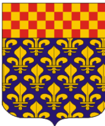
Blason original de MEULAN

Sources : toutes données au cours du texte