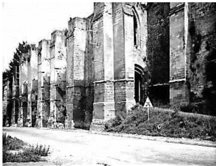
Abbaye de BEAUMONT LE ROGER