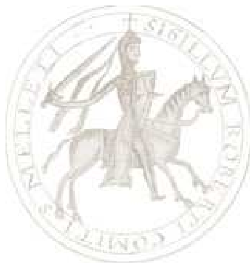
Sceau de ROBERT Comte de MEULAN

Ce qui expliquerait la fidélité de ROBERT II à JEAN SANS TERRE mais aussi peut être à RICHARD CŒUR DE LION : et donc une attirance toute Normande que Capétienne des comtes de MEULAN..